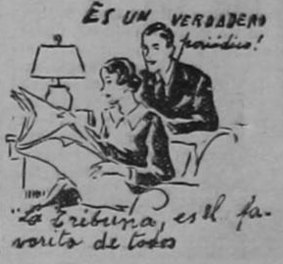
ES UN VERDADERO "FANÁTICO"! "La Tribuna" es el favorito de todos

Es muy dudoso. La guerra por el momento es una palabra política. No es una realidad tangible.